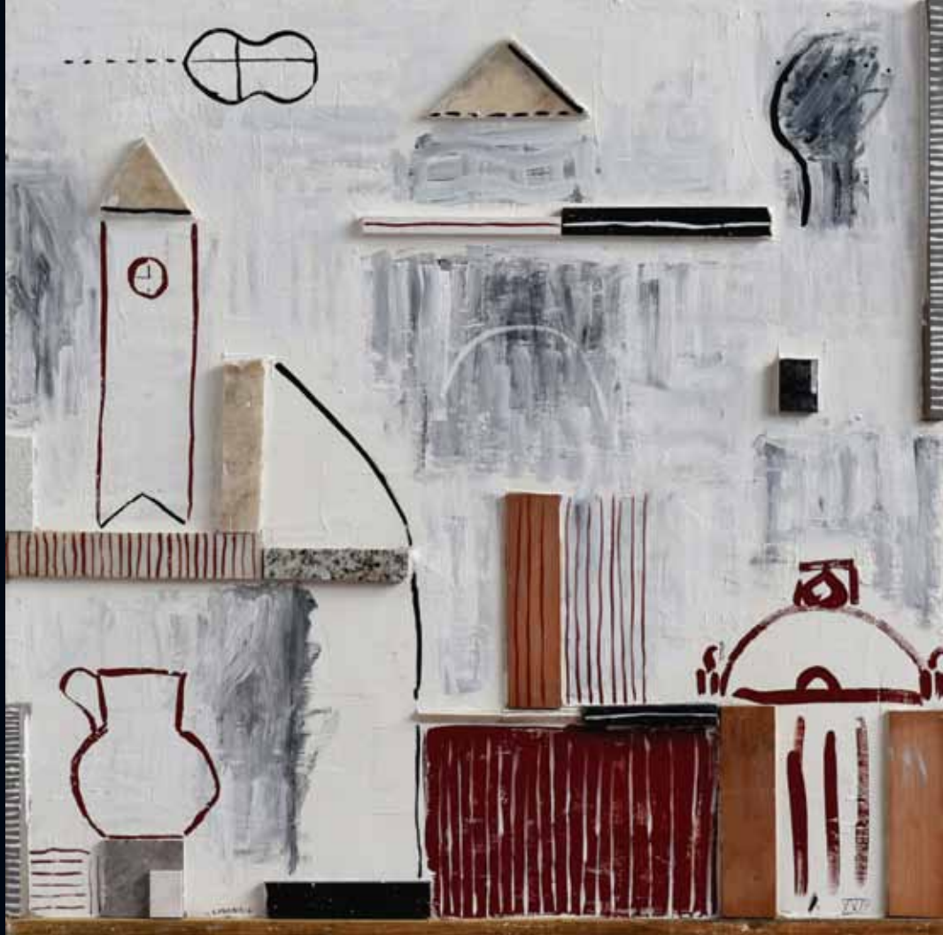
Elemental María Casaravilla

Fresco sobre placa cementicia con relieves de piedra y madera - 120 x 120 cm - 2024