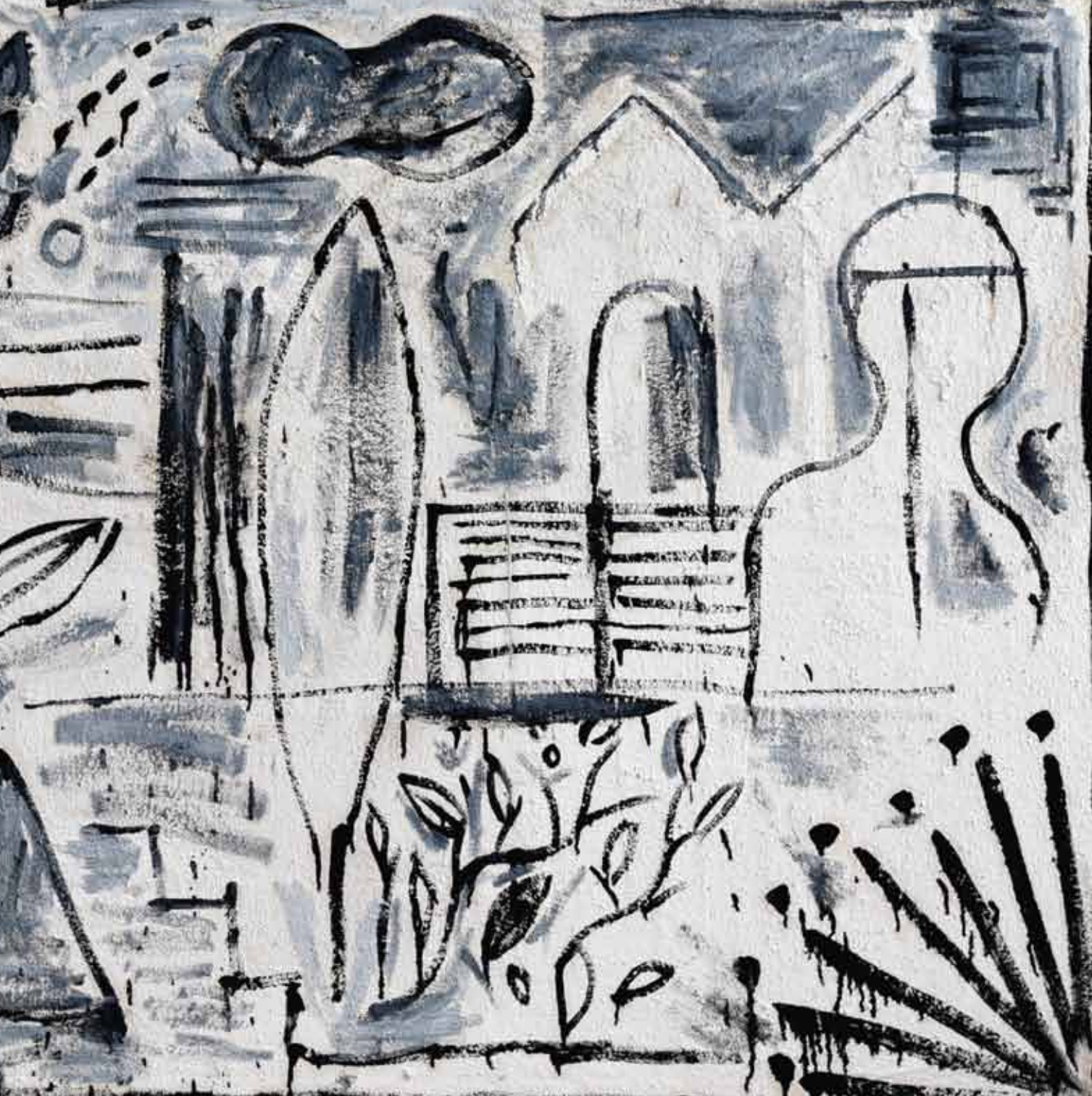
Historia del Taller Pintura colectiva 121 x 166 cm Óleo sobre tela arenada - 2022