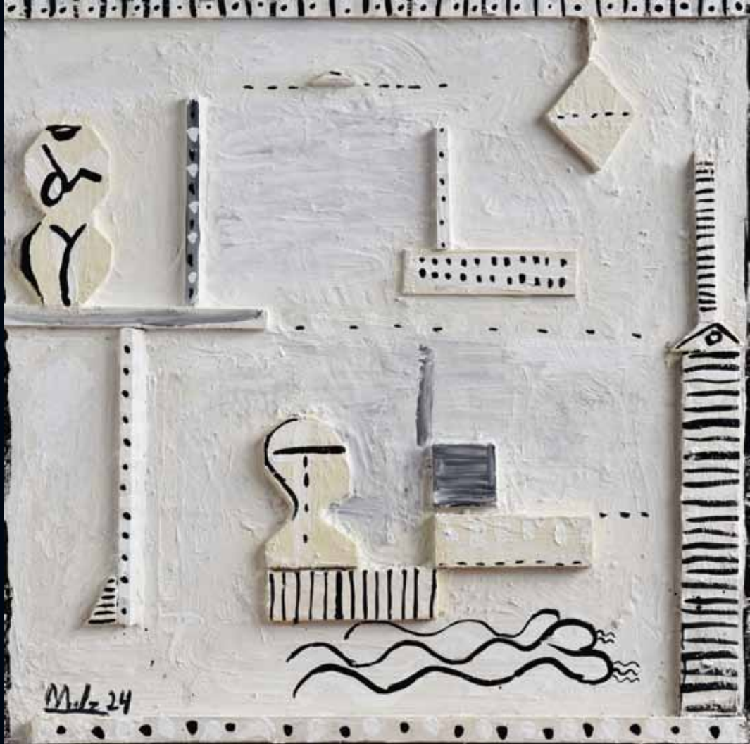
Blanco primitivo Federico Méndez Fresco sobre placa cementicia con relieves de piedra y madera - 120 x 120 cm - 2024