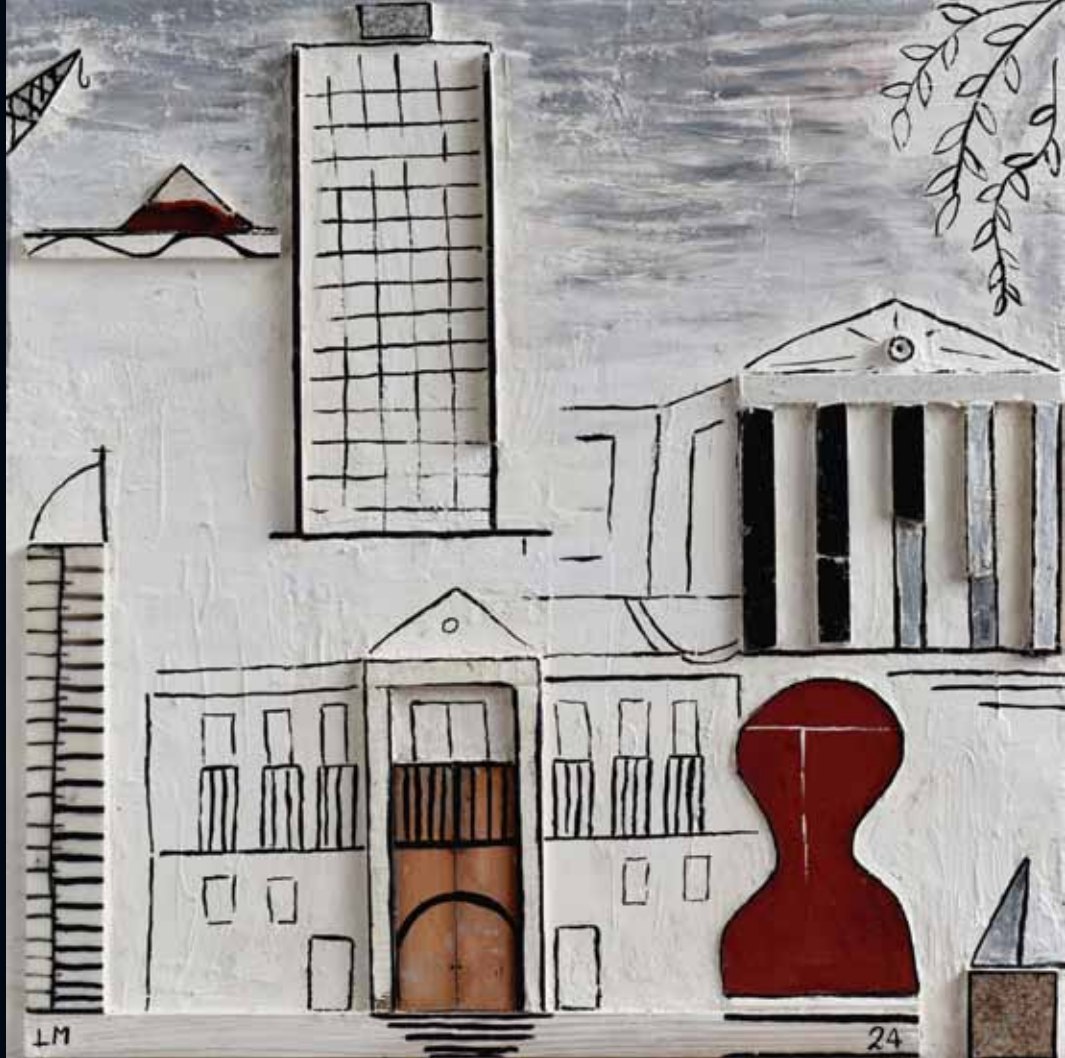
De visita Laura Méndez Fresco sobre placa cementicia con relieves de piedra y madera - 120 x 120 cm - 2024