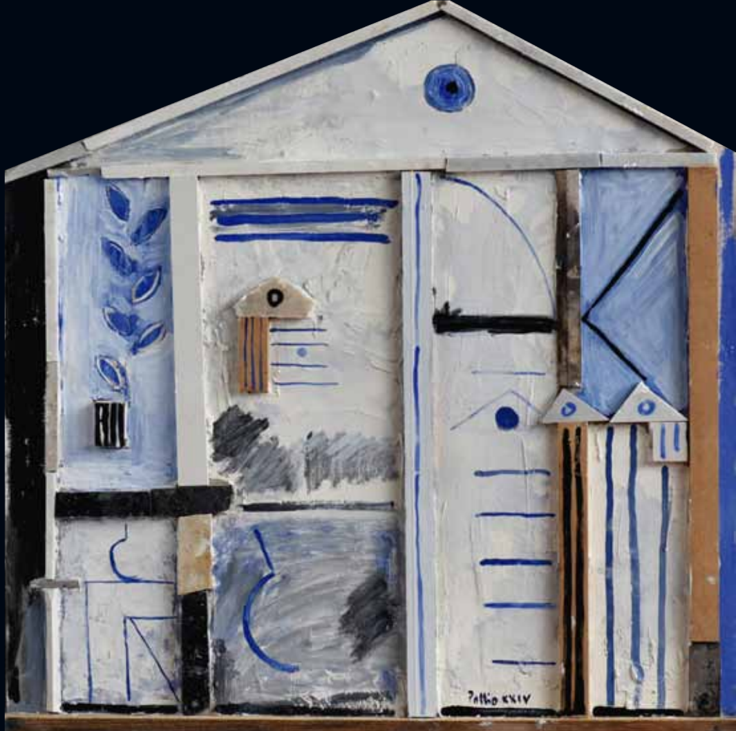
Composición X Cecilia Pollio

Fresco sobre placa cementicia con relieves de madera y piedra - 120 x 120 cm - 2024